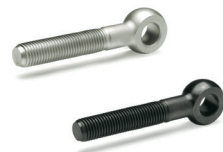
Bundschraube GN 732.1 als Lagerbolzen