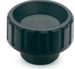
elesa ELESA original design BT. / BT.FP