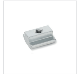
Nutensteine zum Einschieben