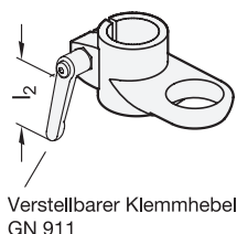
Verstellbarer Klemmhebel GN 911