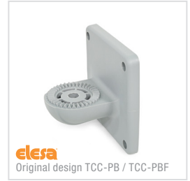
elesa Original design TCC-PB / TCC-PBF