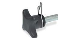
GN 6335.4 → Seite 587 GN 6335.5 → Seite 587 Form ST