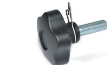
GN 5337.2 → Seite 561 GN 5337.7 → Seite QVX Gr. 32 ... 63